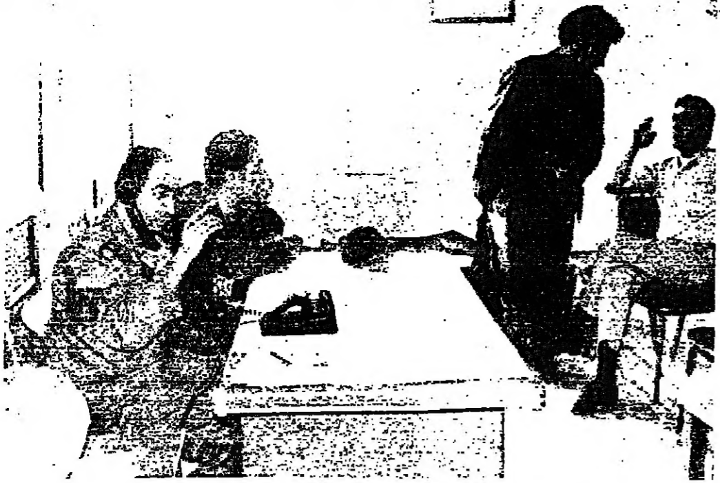
اللجنة المشتركة في مخفر نزل الزيت امس

بقي من الامالي كان في الاجسيه ، والملي تحولت الى مجموعة فوجات. وانظر الحرائق وبقيها الزواج والسلام القسوة ما تزال باقية ، الى جانب بقع كثيرة من نساء القتلى والجرحى. وفي اللحظة الثالثة كان ضباط قوى الابن والقاهرة، يشرون فجان قوية. داخل